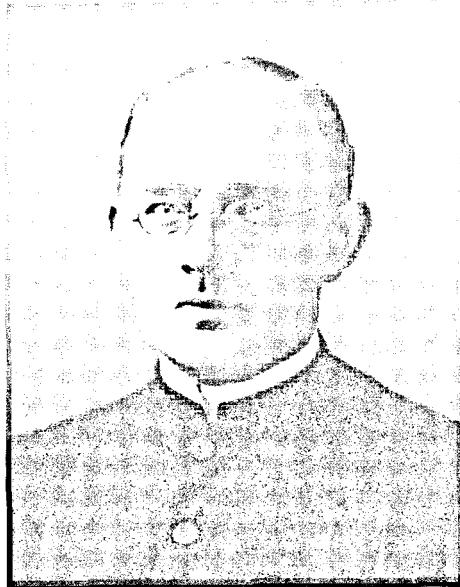
Joseph Sauer (1905)

und „Humanisten“ gewürdigt. 9 Schneiders freudige Aufnahme der zeitgenössischen Möglichkeiten in Kunst und Wissenschaft – ohne religiöse oder nationale Grenzen – waren für Sauer eine wichtige Ermutigung und Anregung zur eigenen geistigen Öffnung. Gleichwohl bewegte sich für Sauer all dies – zumindest im Rückblick – im Rahmen einer unangefochtenen Katholizität: Wie im gesellschaftlichen Umgang sah er auch als Priester auf strengste Wahrung des Dekorums. In diesem starkentwickelten Bewußtsein des Disziplingeistes wurzelt seine unbedingte Hochachtung vor der [kirchlichen] Autorität. Und wenn auch überall mit Entschiedenheit dem obsequium rationale und dem gesunden Fortschritt das Wort redend und mit lebhaftem Interesse und Wohlwollen alle Regungen eines solchen verfolgend, so war er doch für radikale Maßlosigkeiten und Extravaganzen, unter welchem Titel sie auch gehen mochten, nicht zu haben. 10 Diese eher apologetisch gestimmten Worte aus dem kirchenpolitisch „heißen“ Jahr 1907, in dem Papst Pius X. die Jagd auf die „Modernisten“ eröffnet hatte 11 , deuten schon an, dass Sauer – ähnlich wie bei der Andenken-Pflege seines Idols Kraus 12 – einen eher vorsichtigen Umgang mit dem Erbe des Prälaten anstrebte. Zwar hatte er ihm schon zu Lebzeiten den gebühren-