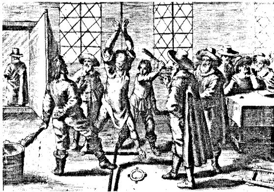
Kupferstiche aus der »Bilder-Cautio«: Bekenntnis unter der Folter des »Halseisens« (oben); Folterung durch »Strecken« und »Stäupen« (unten)

den Hexen her. »Gott und die Natur tun jetzt gar nichts mehr«; alles kommt vom Teufel und von den Hexen. Alles schreit, die Obrigkeit solle gegen die Hexen einschreiten. Also befehlen die Fürsten ihren Richtern und Räten, mit den Hexenprozessen zu beginnen. Die wissen zunächst nicht, wo sie anfangen sollen, und wagen doch aus Gewissensbedenken nicht, etwas ins Blaue hinein zu unternehmen. Darauf schreit das gemeine Volk, dieses Zögern sei nicht unverdächtig, und das gleiche reden sich die Fürsten ein. Den Unwillen der Fürsten zu erregen, ist aber in Deutschland sehr gefährlich. Endlich geben die Richter nach und machen irgendeinen Anfang ihrer Prozesse. Oder – was besonders gefährlich ist – es kommt ein eigener Hexenkommissar, der ein Kopfgeld für jede verbrannte Hexe erhält. Irgendeine Frau, die aus irgendeinem Grund in schlechtem Ruf ist und Neider hat, wird nun belastet und zur Folter geschleppt. Die Folter in allen Graden wird beliebig oft wiederholt. Während es bei normalen Kriminalprozessen Beschränkungen der Folter gibt, ist Hexerei ein Sonderverbrechen; es gibt weder Verteidigung noch Grenzen in der Folter, auch keine Chance, sich durch noch so große Standhaftigkeit bei der Folter zu rechtfertigen. Und das Netz ist unentrinnbar: Hat die Frau versucht, zu fliehen, so fühlt sie sich offenbar schuldig – flieht sie nicht, so ist auch dies ein Schuldbeweis; denn der Teufel hält sie fest.