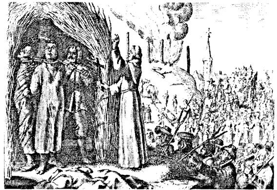
Kupferstiche aus der »Bilder-Cautio«: Nach der Tortur (oben); Hexenverbrennung (unten)