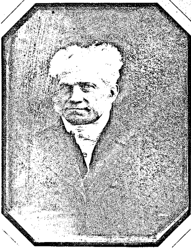
Arthur Schopenhauer (1788–1860).

Arthur Schopenhauer schätzte die „Theologia deutsch“ außerordentlich: Ex libris und handschriftlicher Vermerk des Philosophen aus seinem Handexemplar.