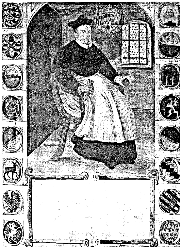
Abb. 31: Otto Kardinal Truchseß von Waldburg, um 1606