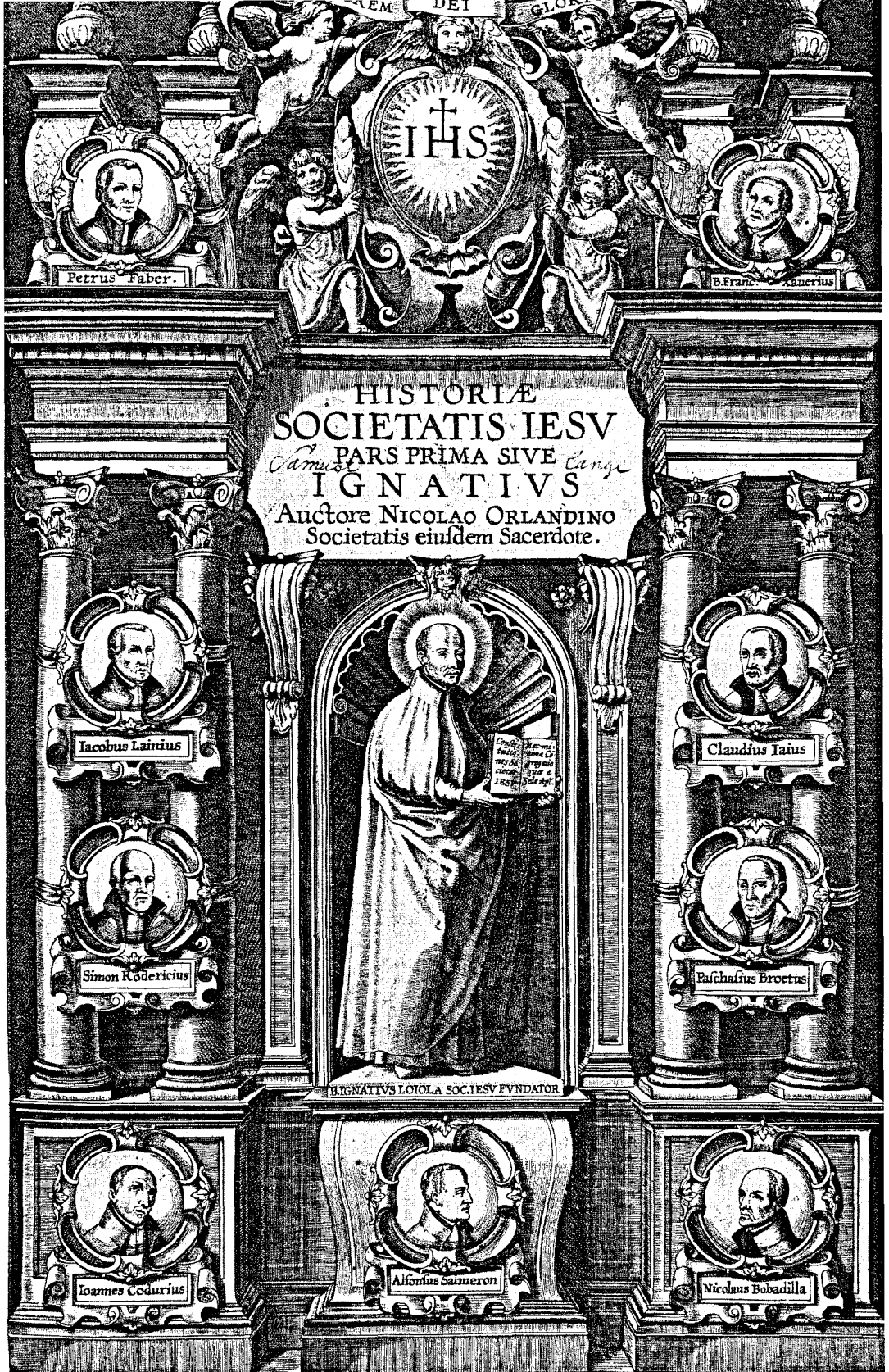
Abb. 33: Ignatius und die ersten Gefährten, Titelkupfer zu Nicolaus Orlandinus, „Historiae Societatis Iesu Pars Prima Sive Ignatius“, Antwerpen 1620