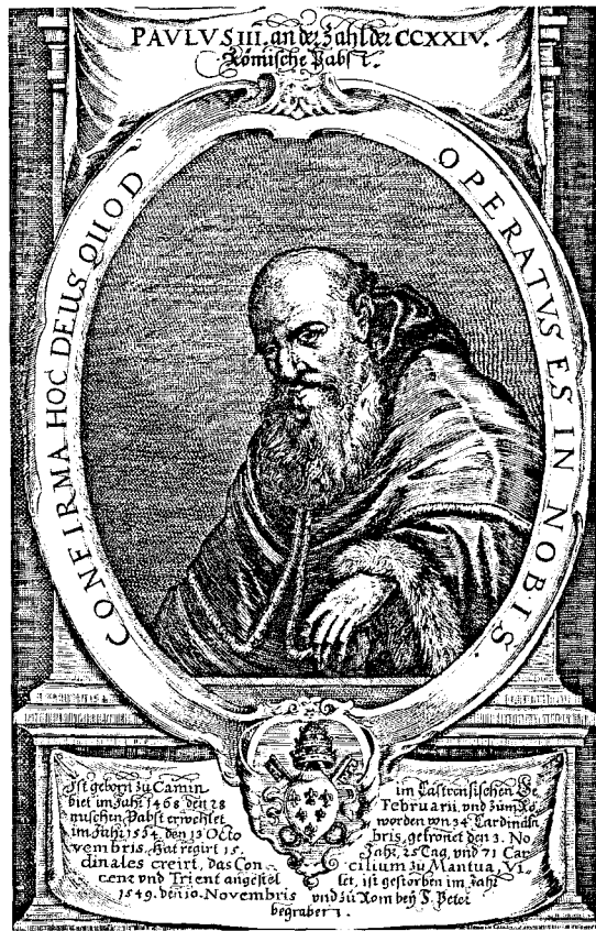
Abb. 30: Papst Paul III., Kupferstich, 17. Jh.