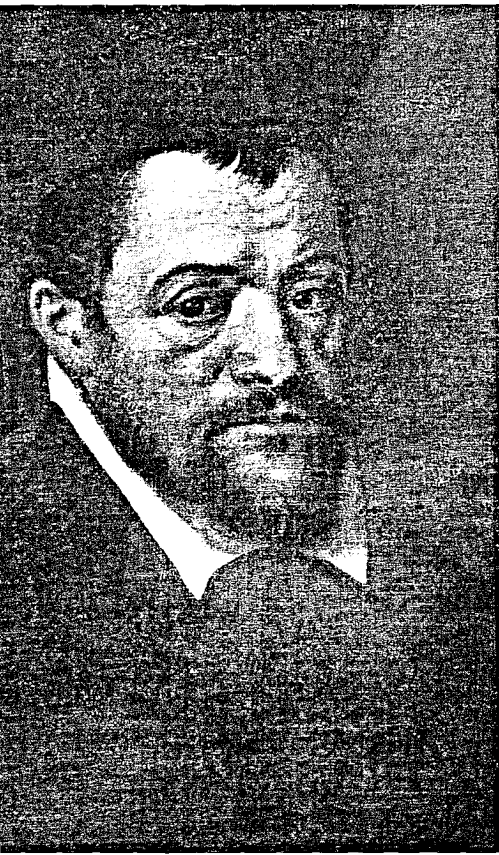
Abb. 34: Kardinal Morone