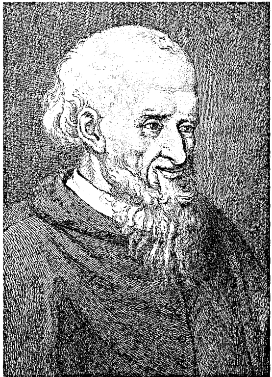
Abb. 35: Kardinal Hosius